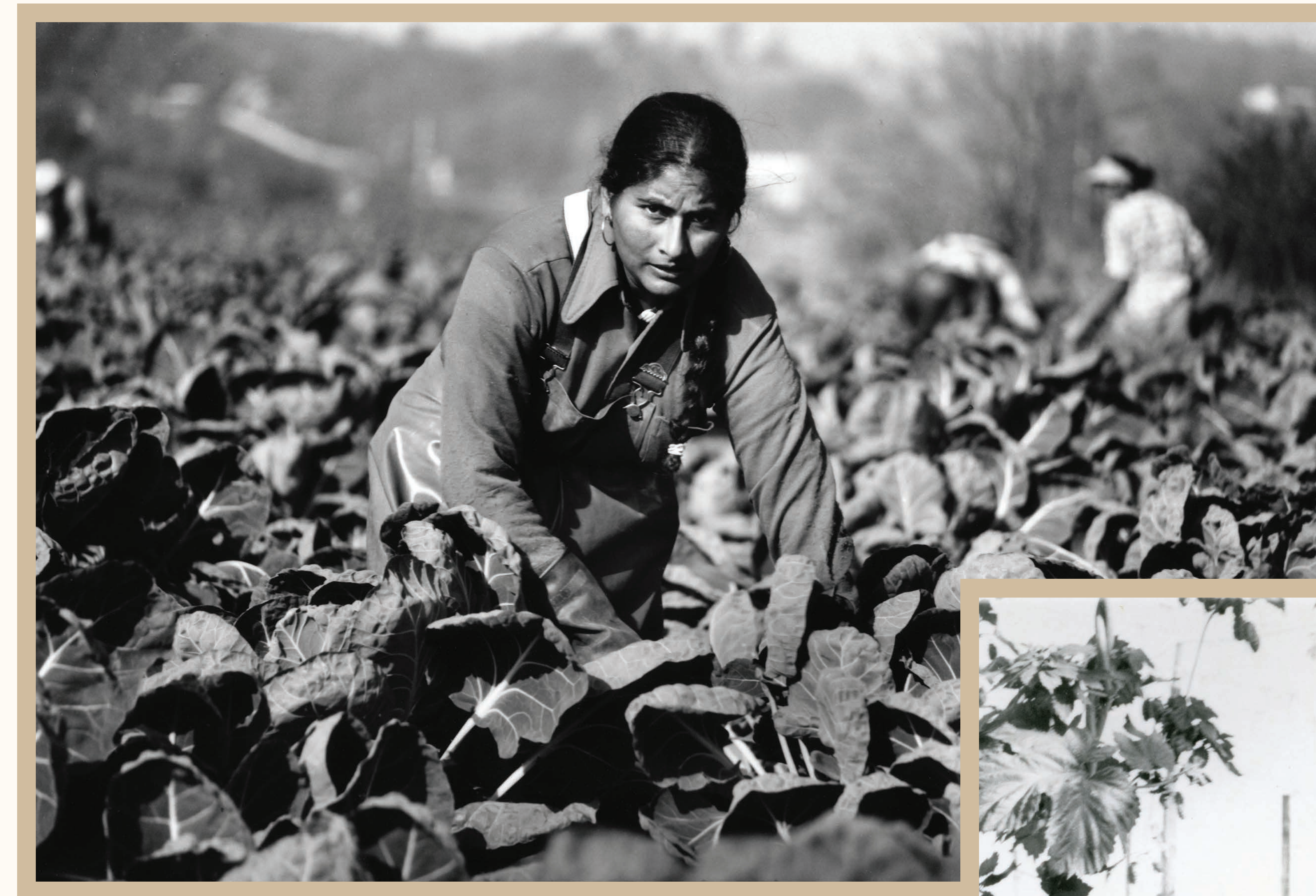
Woman field worker topping Brussel sprout suckers. Taken in Aldergrove, BC, October 1983.

ਆਰਥਿਕ ਮੌਕਿਆਂ ਦੀ ਭਾਲ ਵਿੱਚ, ਪੰਜਾਬ ਤੋਂ ਸਿੱਖ ਪ੍ਰਵਾਸੀ 1903 ਦੇ ਸ਼ੁਰੂ ਵਿੱਚ ਹੀ ਬੀ.ਸੀ. ਪਹੁੰਚੇ। ਬਹੁਤ ਸਾਰੇ ਲੋਕ ਰਵਾਇਤੀ ਖੇਤੀਬਾੜੀ ਗਿਆਨ ਨਾਲ ਆਏ ਸਨ। ਆਪਣੇ ਖੇਤੀਬਾੜੀ ਹੁਨਰ ਦੀ ਵਰਤੋਂ ਕਰਦੇ ਹੋਏ, ਉਨ੍ਹਾਂ ਨੇ ਪਹੁੰਚਣ 'ਤੇ ਖੇਤੀ ਦਾ ਕੰਮ ਲੱਭਿਆ।